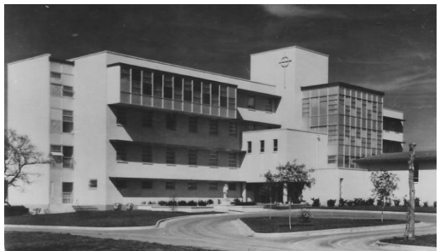
Das Kloster in San Antonio, Texas im Mai 1984